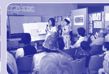
昨年度のイベント会場の様子