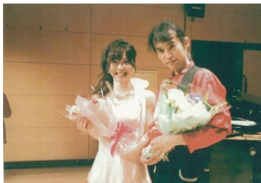
【チャリティコンサート①】

精神障害者を抱える家族が、悩みを分かち合いながら、さまざまな問題を解決したいと2003年9月に結成されました。当事者を支え、回復につなげるためには、まず「家族が元気になろう」を目標としています。月3回の談話会（悩み、困り事の相談）及び、講師を招いての出前講座（勉強会）をしています。また、このような家族会がある事を知ってもらう目的で、皆さんと一緒に楽しめるチャリティコンサートも行っています。会場ロビーにて、会の活動の展示及び、精神障害者の作業所で作っている作品の販売をしています。