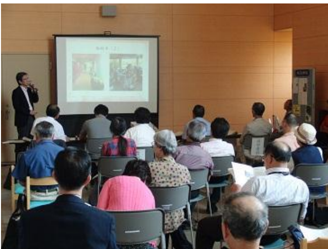
＜昨年度の公開報告会の様子＞