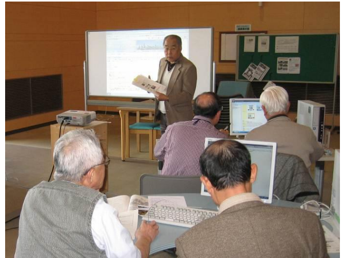
情報ネット発信講座の様子