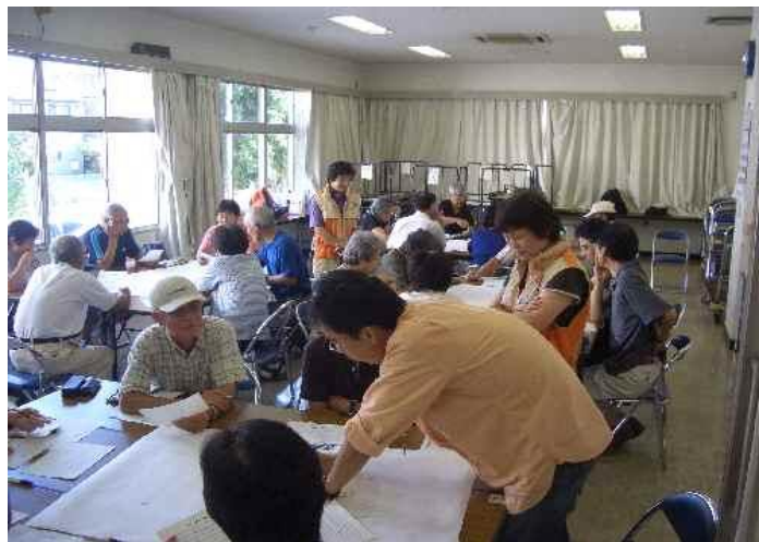
マイタウン情報収集ゲーム（三田公民館）