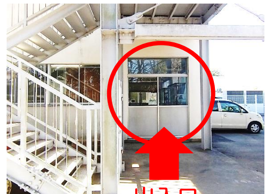
春休み期間の出入口

*出入口で上履きに履き替え、履いてきた外靴を持って活動場所（2階の少人数教室）に来てください。