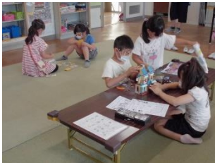
船っ子教室の様子