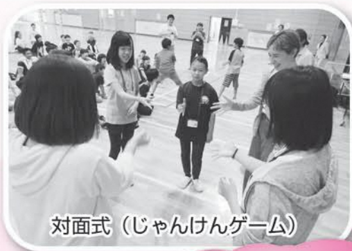
対面式 (じゃんけんゲーム)