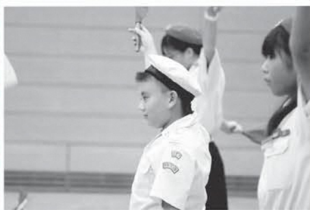
会場は国立オリンピック記念館