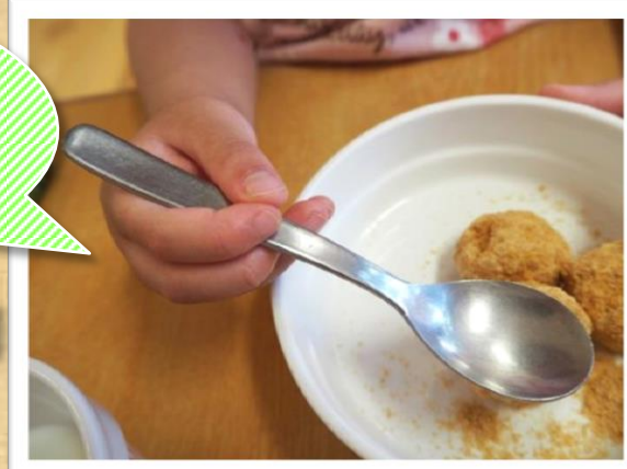
スプーンを下から親指、人差し指、中指の三点で持てるようになります