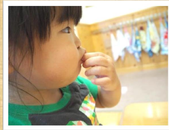
親指と人差し指を使ってつまめます 少しずつ指が入らなくなってきます