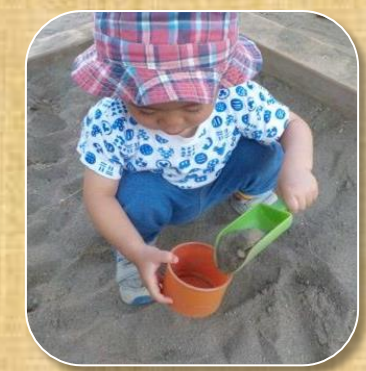
スコップで砂を移す