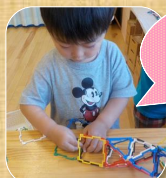
ジオシェイプスで色々な形を作成