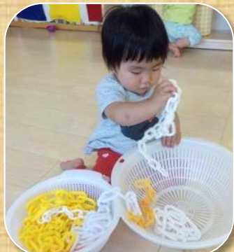
物を握って隣に移す