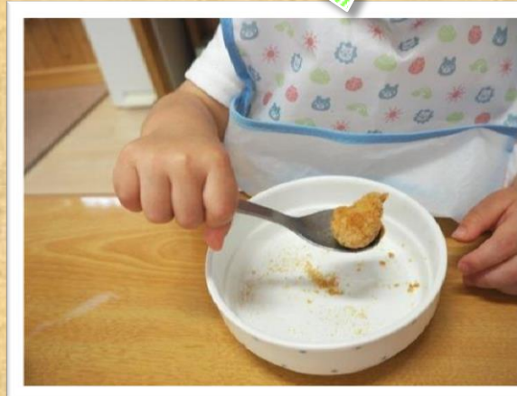
スプーンを5本の指でギュッと握ります