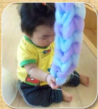
色々な感触を楽しむ