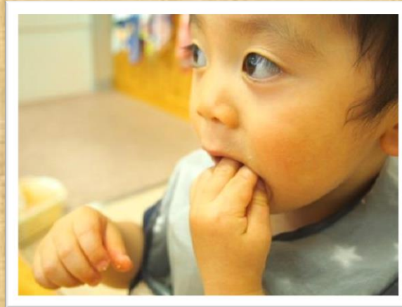
指も一緒に口の中に入ります 親指と他の指を使って食べます