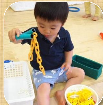
ホースで作ったトングで物をつまむ