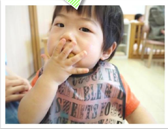
最初は・・・ 手全体を使って口に押し込みます