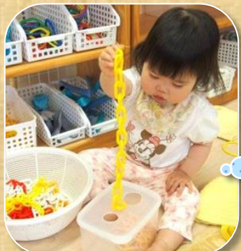
チェーンを穴に入れる