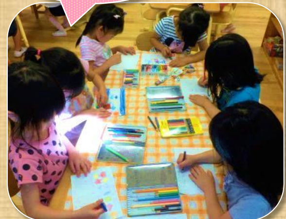
お絵かき中・・・