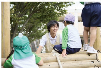
～県内養成施設での授業の様子～