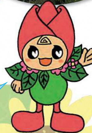
リユちゃん リユースの妖精