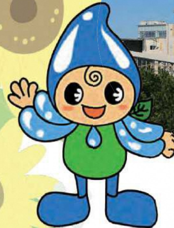
リデュくん リデュースの妖精