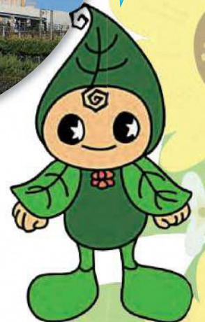
リサちゃん リサイクルの妖精