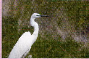
ダイサギ 干潟 浅瀬