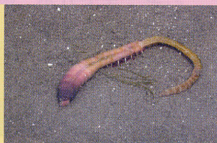
タマシキゴカイ 干潟 浅瀬