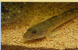
マハゼ 浅瀬 航路跡地