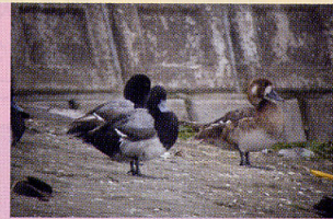
スズガモ 浅瀬 航路跡地