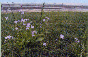
ハマダイコン 砂浜