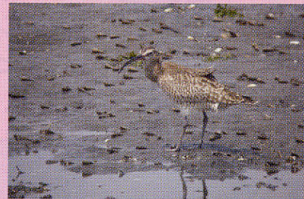
チュウシャクシギ 干潟