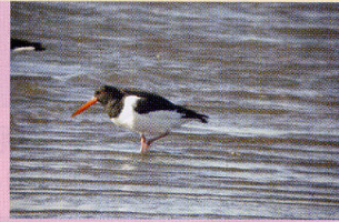
ミヤコドリ 干潟 浅瀬