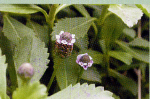
イワダレソウ 砂浜