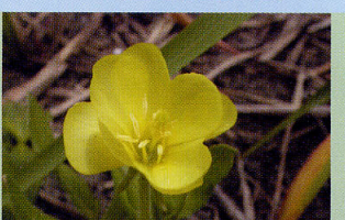
コマツヨイグサ 砂浜