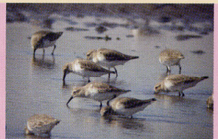
ハマシギ 浅瀬 航路跡地