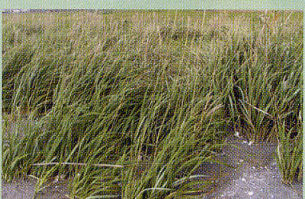
ハマニンニク 砂浜