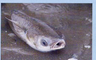
ボラ 浅瀬 航路跡地