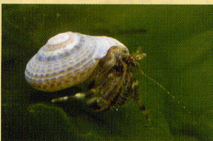
ユビナガホンヤドカリ 浅瀬