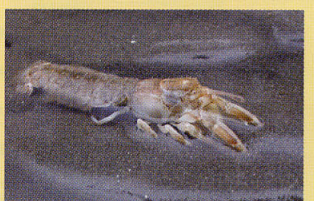
アナジャコ 干潟 浅瀬