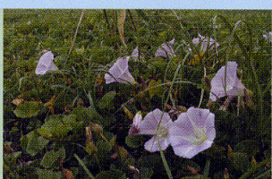
ハマヒルガオ 砂浜