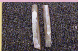
マテガイ 干潟 浅瀬