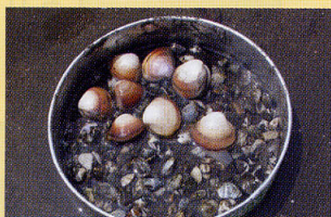
シオフキとアサリ 干潟 浅瀬