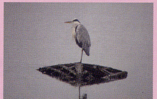
アオサギ 干潟 浅瀬