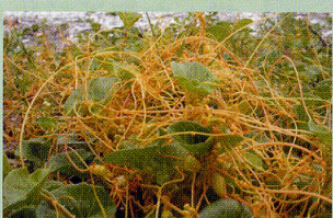
アメリカネナシカズラ 砂浜