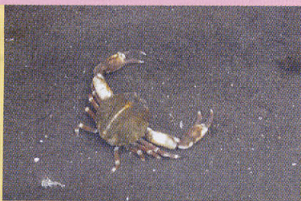
マメコブシガニ 干潟 浅瀬