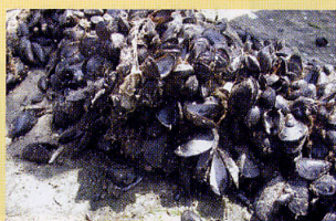
ムラサキガイ 干潟 護岸