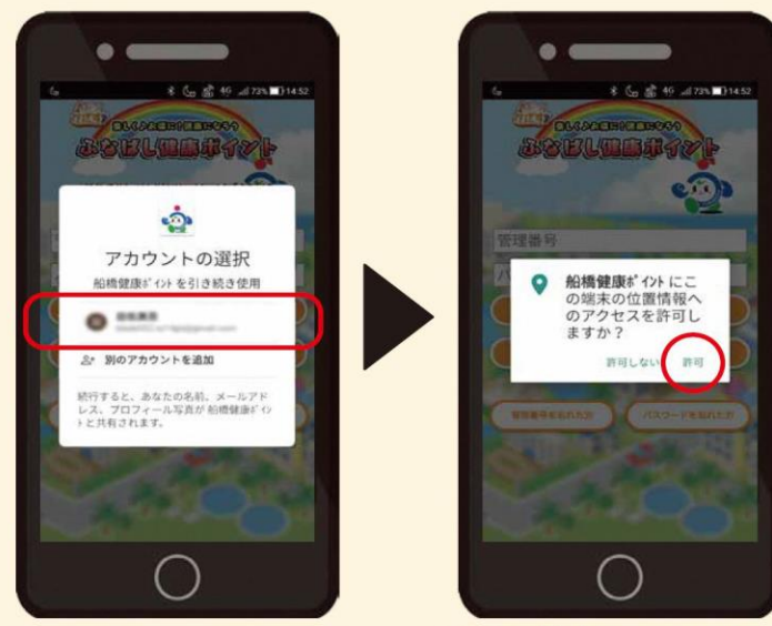
②アカウントの選択