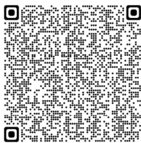
アンケート調査フォーム QR コード

URL : https://forms.office.com/r/epQ1TRdasb