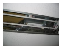
器具内に古い安定器が残っている例