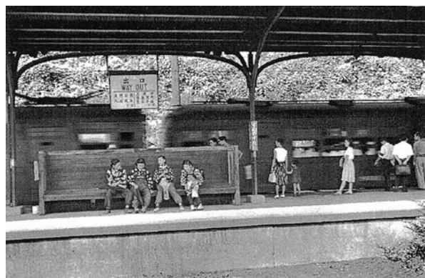
■作者の地元、何度も撮影した鶯谷駅の情景 (昭和23年 鶯谷)

戦前・戦後を通じてスナップ、ポートレート、ドキュメンタリーと多彩な分野で第一人者として活躍し、1950年(昭和25年)に日本写真家協会の初代会長に就任。一写真家として、また写真界を支える立場として、1974年(昭和49年)に72歳で没するまで、常に第一線でトップとして活躍し、日本の写真界をけん引し続けた。