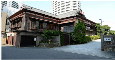
会場の玉川旅館 令和2(2019)年