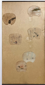
国産産物が集められた屏風