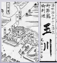
船橋市 千原橋駅前バス停留所(徒歩約2分)より