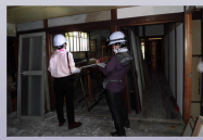
展示物調査の様子 令和2(2019)年