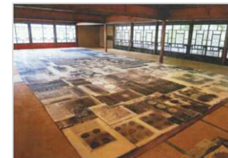
玉川旅館 大広間の宴会場