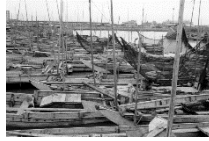
昭和32年船橋港舟だまり