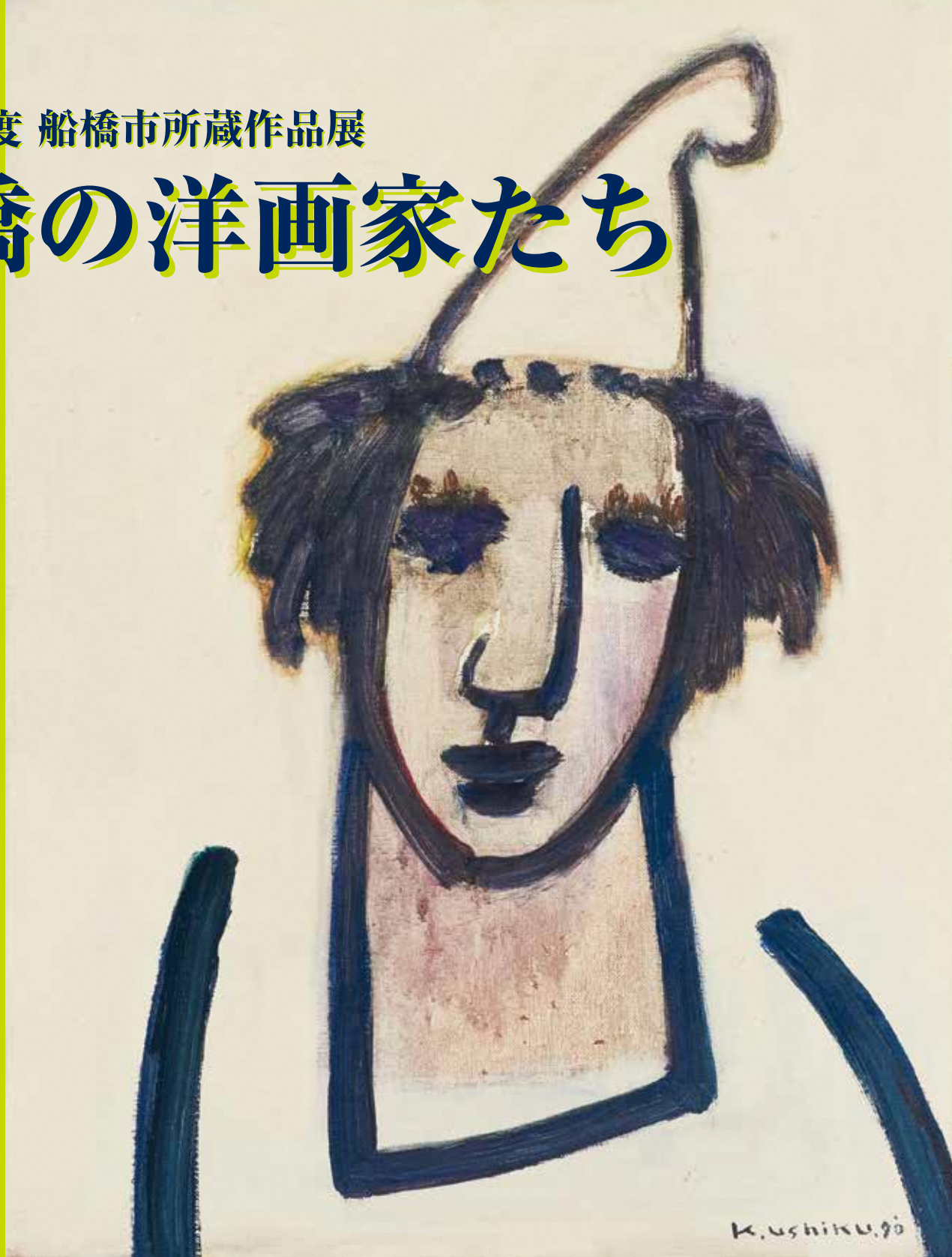
牛玖健治《無題（ピエロ）》1990年