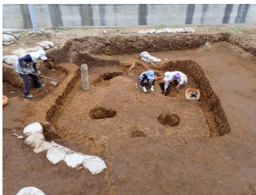
印内台遺跡群(92)発掘調査の様子