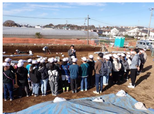
川ノ上遺跡(10)(芝山東小)見学会の様子