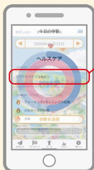
③ヘルスケアとの連携