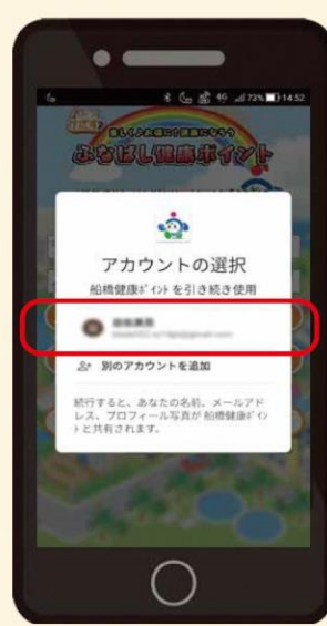
②アカウントの選択