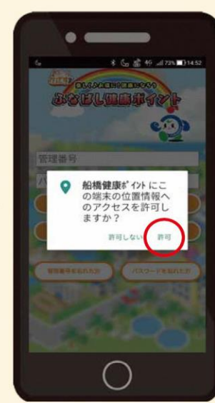
③位置情報のアクセス