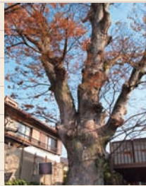
▲「葛羅井のケヤキ」 名木10選の一本。道ばたにどっしりと立っている