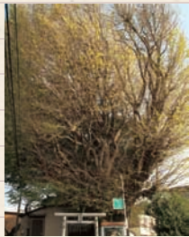
▲「道祖神社のイチョウ」 東船橋駅から徒歩5分ほどの場所にある道祖神社のイチョウ。名木10選の一本

市内の神社の多くには紅葉樹が植えられていて、シーズンには鮮やかな紅葉を楽しむことができます。代表的なところとしては、船橋名木10選に選ばれている「二宮神社のイチョウ」「道祖神社のイチョウ」「葛羅井のケヤキ」などが挙げられます。市内北部に位置する「船橋県民の森」も紅葉が楽しめるスポットです。15haの自然そのままの姿を残す森のなかにはモミジなどが生い茂り、11月下旬～12月上旬くらいまで美しい紅葉を見ることができず。