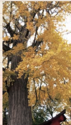
▲「二宮神社のイチョウ」 雌木で幹回りは約4.7m、高さは約25mある。船橋市の名木10選の一本