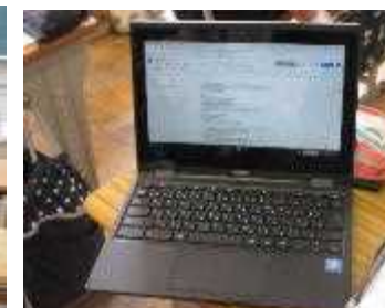
生徒が使用しているパソコン