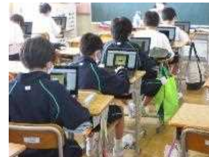
タイピング練習の様子