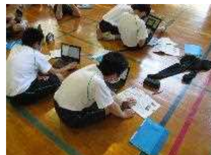
体育の授業の様子

昨年度末より準備を始めていたGIGAスクール構想により、1人1台の端末が整備され、少しずつではありますが、授業でも使い始めています。4月に行ったGIGA開きでは自分専用の新品のパソコンを目の前にし、うれしそうにパソコンを操作している姿が印象的でした。個々の生徒が自分の考えを端末に入力することで、教員が全体の考えを把握したり、生徒同士が考えを共有したりすることができます。タイピングなど不慣れな生徒もおりますが、生徒が負担に感じないようにゆっくりと進めてまいります。ご家庭でも使用できる環境がございましたらタイピングの練習などをしてみて下さい。