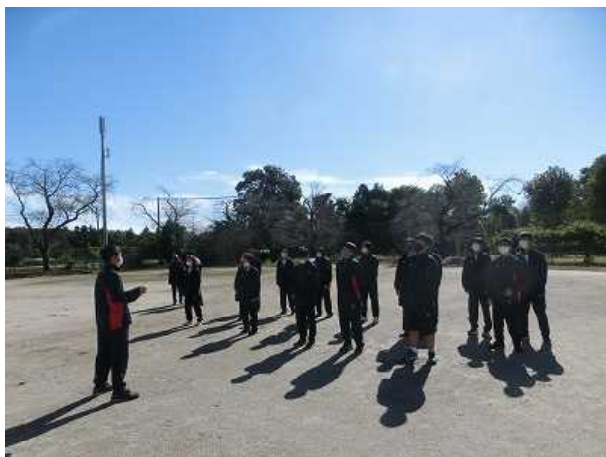
合唱練習in the open air

朝8時に昇降口前で、卒業アルバムのための職員集合写真を撮りました。ちょうど生徒の登校時刻と重なったので、運よく現場に遭遇した人もいたようです。「もう、そんな季節になったのだなあ」と、朝からちょっとしみじみした今日でした。