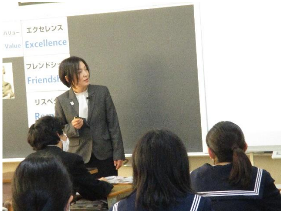
24歳の時長野オリンピックに感銘を受けた。