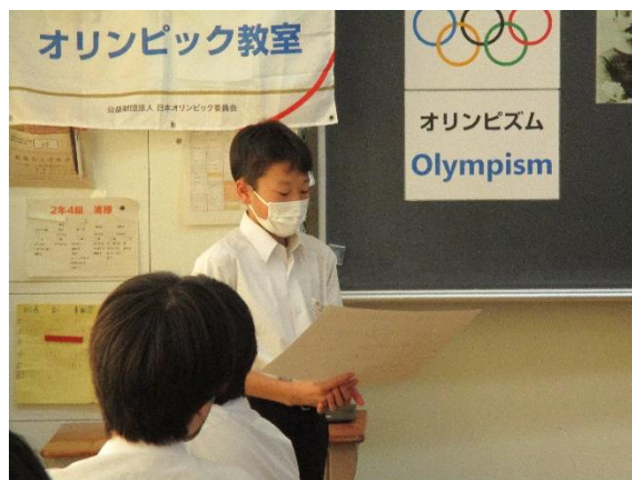
班ごとに代表を決めて発表します。