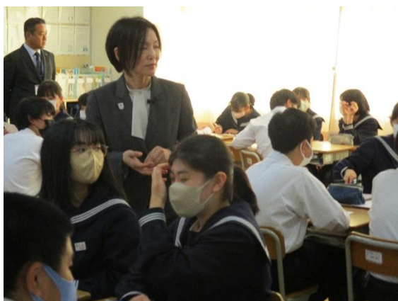
班ごとに話し合いました。