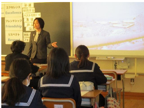
家と練習場が近かった。