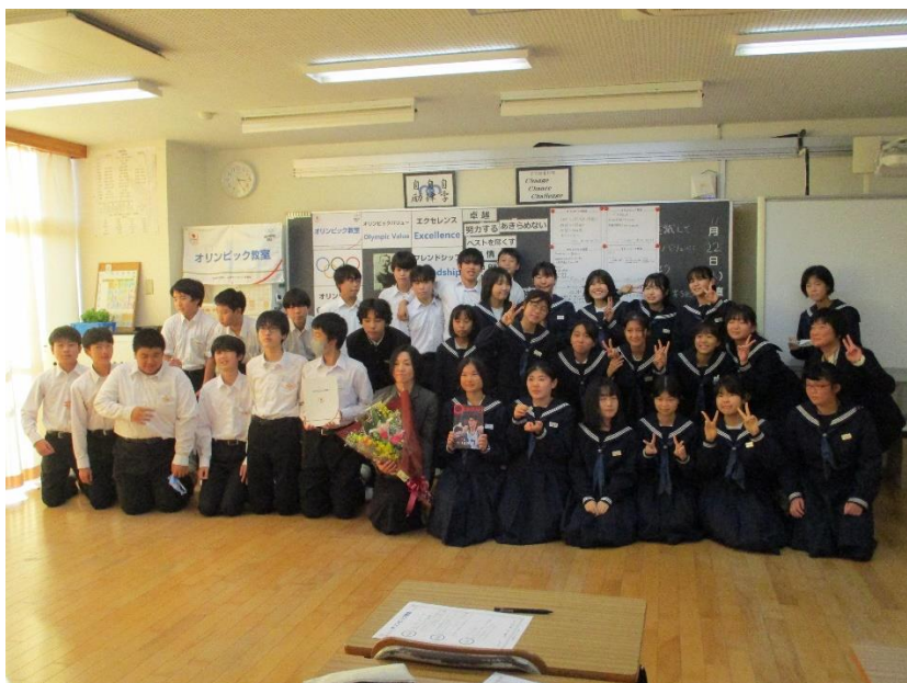
集合写真②（花束贈呈後）