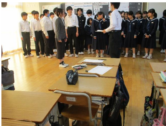
記念品とバッジをもらいました。