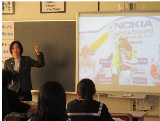
自分でオリンピックに出る方法を調べた。