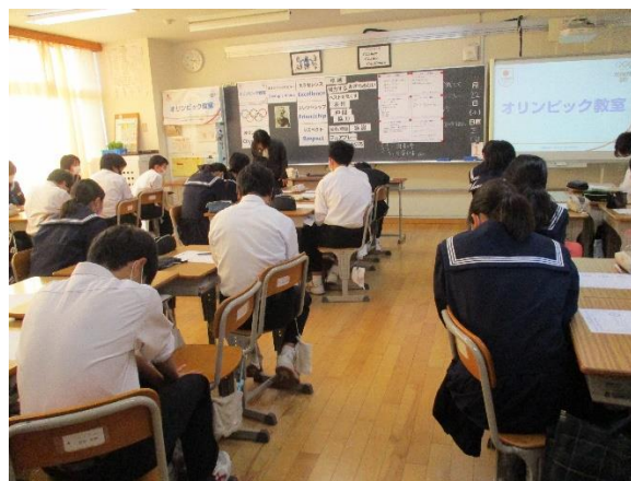
授業の終わりの挨拶