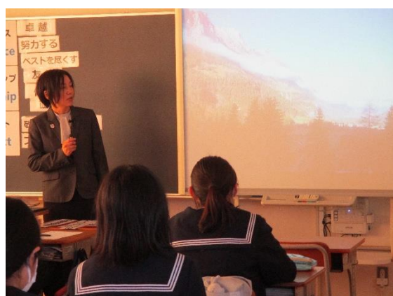
海外の選手はそんな恵まれていない