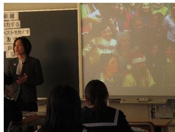
パーティにでる条件「はずかしいセーターを着てくること」