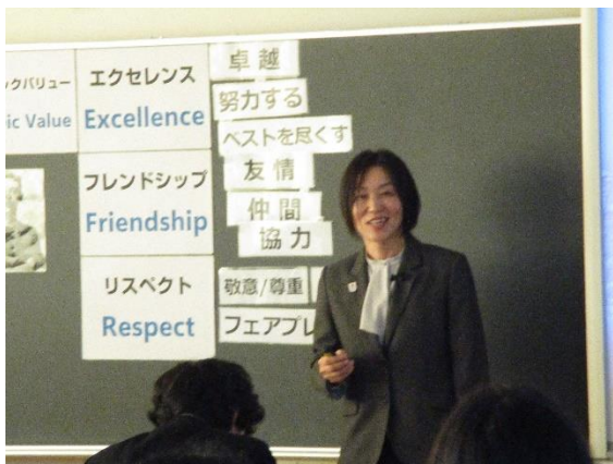
オリンピックバリューでみんなの活動を振り返ろう