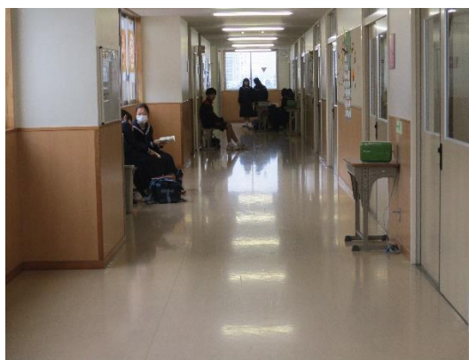
家庭科で残る生徒