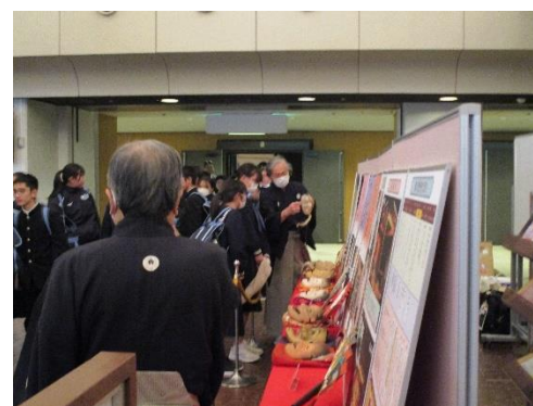
入口のパネルです。5種類の面の説明や能の衣装、歴史について説明が書かれていました。