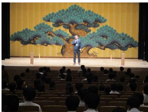
校長先生のあいさつ