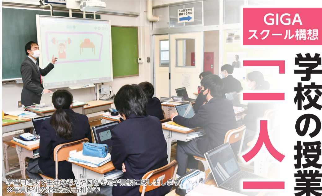
学習用端末で生徒の考えや回答を電子黒板に映し出します ※写真は研究指定校の古和釜中

小学校ではこうした機器を使っていなかったのですが、中学に入学した当初は扱いに慣れていませんでした。小学生から機器の扱いに慣れれば、中学で使用するときにはより範囲の広い情報収集ができると思います。機器を使った授業は便利なのですが、ノートを取ることにメリットはたくさんあるので、両方を上手に活用し勉強をしていきたいです。