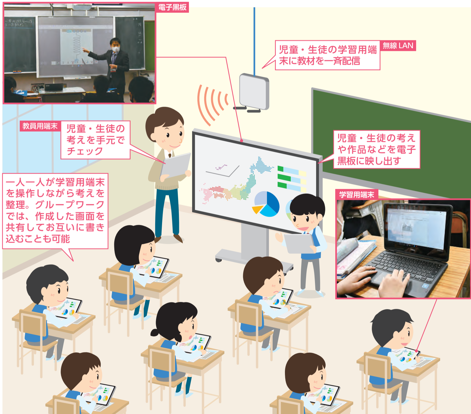
写真はいずれも古和釜中