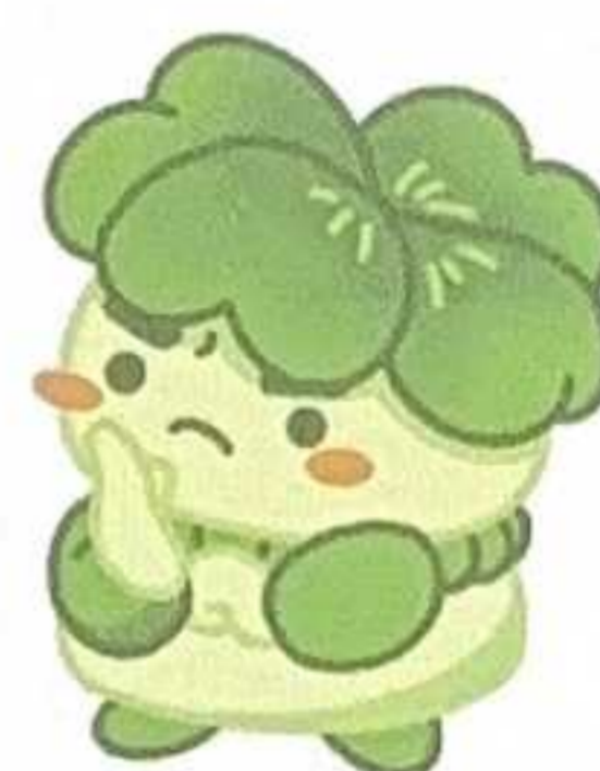
千葉県子どもと親のサポートセンター マスコットキャラクター こさぼん