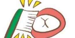
歯ブラシの毛先を 歯の面にあてる