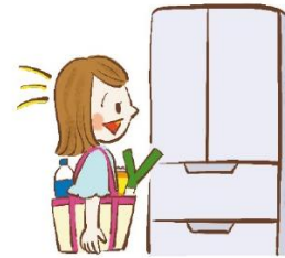
帰ったらすぐ冷蔵庫へ

6月に入り、ジメジメとした蒸し暑い日が続きます。梅雨から夏にかけての気候の特徴である「高温」と「多湿」は、どちらも細菌が繁殖しやすい環境のため、食中毒が頻発する好条件と言えます。菌やウイルスを防ぐため、手洗いや調理器具を清潔にすることや、食べ物が悪くなる前に食べるなど注意しましょう。