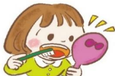
鏡を見ながらみがいて、 みがき残しをチェックする