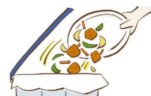
少しでも怪しいと思ったら捨てる