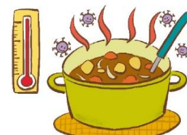
室温で長時間放置しない

食中毒が多い季節です。買い物や調理をするときは気を付けましょう！食品を購入したり、家にあるものを食べたりするときには、消費期限を確認してみましょう。