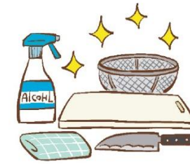
手指や調理器具は清潔に