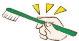
軽い力で えんぴつ持ち