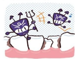
歯並びがでこぼこしている箇所