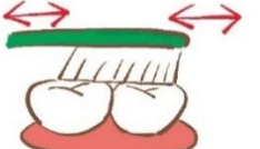
こきざみに 動かす