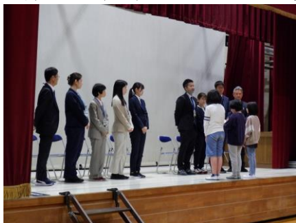
新しい先生方との出会い