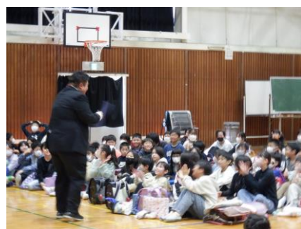
どきどきの担任発表!