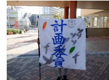
児童会あいさつ運動