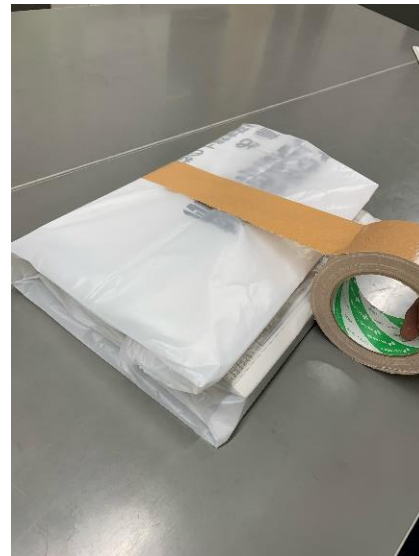
⑤布ガムテープでとめる