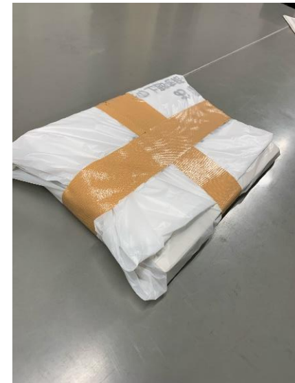
⑥十字にとめたら、完成