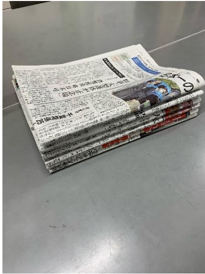
①新聞を6部ほど重ねる