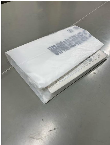
④きれいに折りたたむ