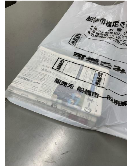
③ゴミ袋の中に新聞紙を入れる