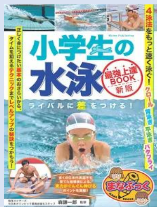
小学生の水泳 最強上達 BOOK

もうすぐ夏休みですね♪夏といえば!海水浴にプールに川遊びなど、水のレジャーが楽しいですよ!アンデルセン公園のじゃぶじゃぶ池、運動公園の流れるプール、勝浦の海水浴など、計画を立てるのが楽しみです。ただ、楽しい夏のレジャーですが、小学生の水の事故が毎年ニュースになっています。川に流されてしまったり、今年に入ってからは海での死亡事故もありました。みなさんは、水泳授業を真面目に取り組んでいますか?命を守る大切な授業だということを忘れずに。