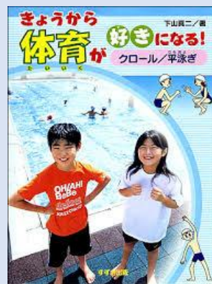
体育が好きなになる クロール・平泳ぎ