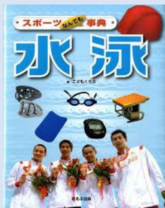
スポーツ事典 水泳