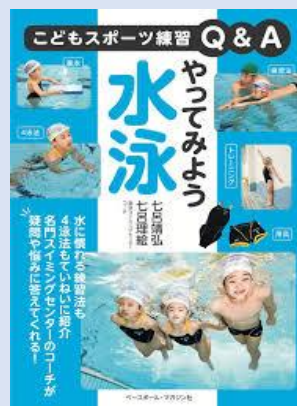
練習 Q&A やってみよう水泳