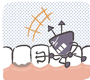
は しにく あいだ 歯と歯肉の間

た 食べた後の歯の汚れを、 は 歯みがきで落としましょう。 は 歯ブラシをえんぴつのように も 持ち、細かく動かすときれ いにみがけます。 まいにち 毎日みがきましょう！