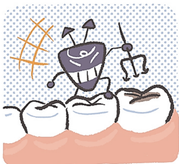
おくほ 奥歯の みぞ