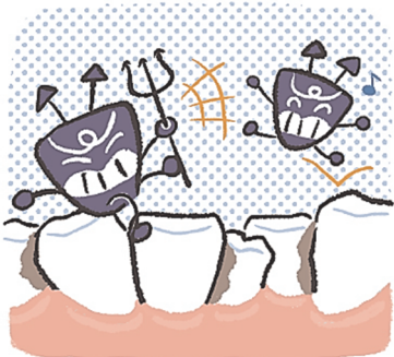
は 歯がでこぼこ している場所

た 食べた後の歯の汚れを、 は 歯みがきで落としましょう。 は 歯ブラシをえんぴつのように も 持ち、細かく動かすときれ いにみがけます。 まいにち 毎日みがきましょう！