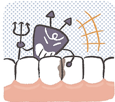
は は あいだ 歯と歯の間

あめ おお きせつ 雨の多い季節がはじまります。 すいぶん たいちよう き こまめに水分をとり、体調に気をつけて過ごしましょう。