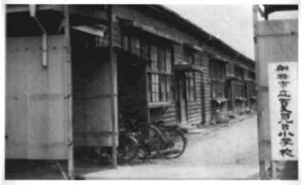
開校当時の仮校舎（1学期間、八栄小に同居）