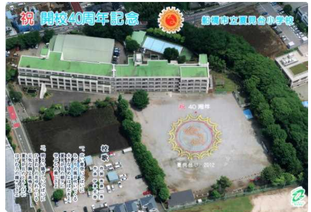
<耐震補強前の校舎>