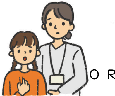
せんせい いっしょ く 先生と一緒に来る