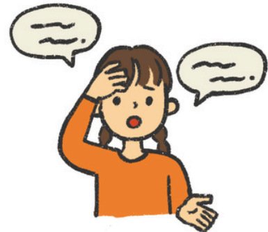
き りゆう い 来た理由を言う