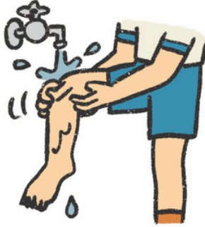
きず とき しっかり 傷はしっかり洗う