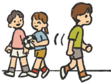
やす じかん く なるべく休み時間に来る