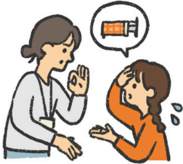
せんせい つた 先生に伝える