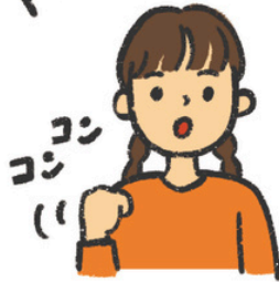
はい あいさつして入る