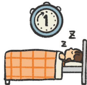
やす じかん 休めるのは1時間まで