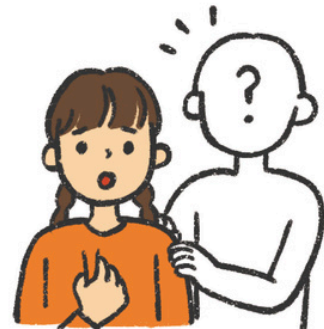
だれ いっしょ く 誰かと一緒に来る