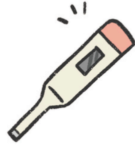
けんおん 検温する