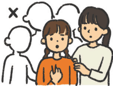
つき そ しょうにんずう 付き添いは少人数で