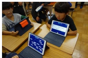
2年生の学習の様子②