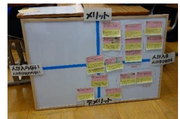
5年生の学習の様子①