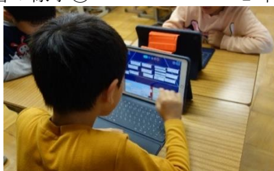
5年生の学習の様子②