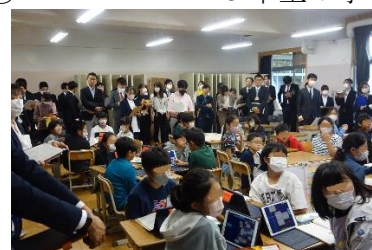
たくさんの参観者

※個人情報保護の観点から、写真の一部を加工させていただいております。ご了承ください。