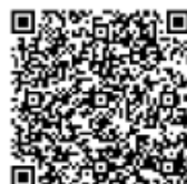
教育広報「夢気球」vol.67 (デジタルブック)