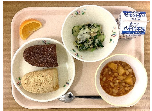
〜こどもたちに、大人気の二色揚げ パン！〜