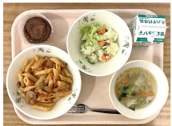
〜4月にも登場するペンネ！〜