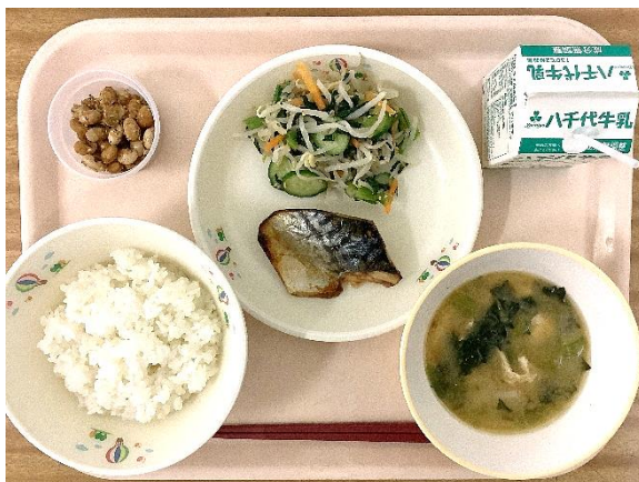
〜さばやさけ、たら、ししゃも、しいら など、たくさんのお魚が登場！〜