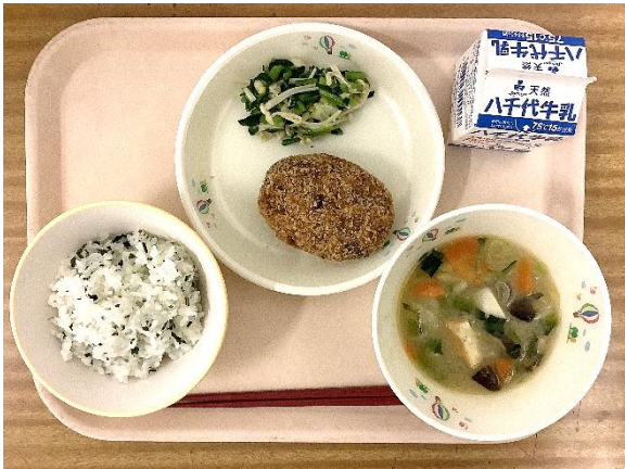
〜1つ1つ手作りしているごぼうの コロッケ！〜

さくねんどていきょう きゅうしょく いちぶ しょうかい かなすぎだいしょうがっこう えいようし ちょうりいん あ 昨年度提供した給食の一部を紹介致します！金杉台小学校では、栄養士・調理員合わせ て7人のメンバーでみなさんに安心安全で美味しい給食を届けられるよう、頑張っています！ 下の写真以外にも、給食には、まだまだたくさんの食材や料理がでていきます。楽しみにしていただきね♪