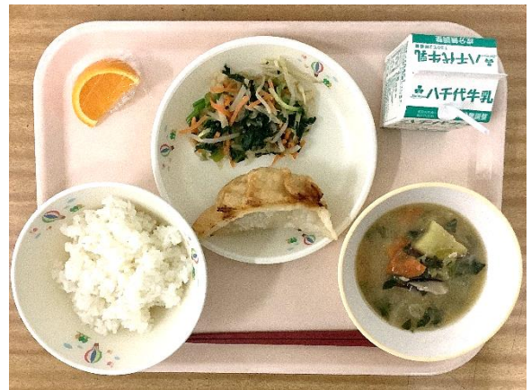
〜15 cmの皮で包むジャンボ揚げ ギョウザ！〜