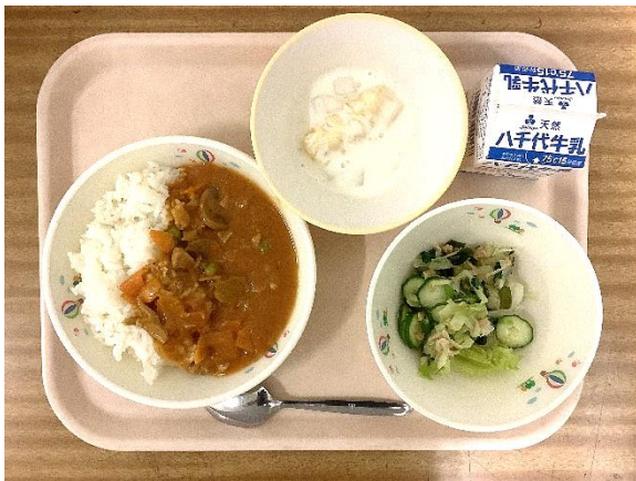
〜ルーから作るカレーライス！〜