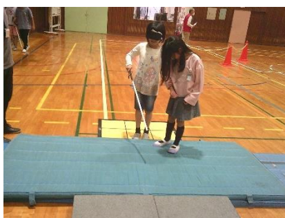
4年アイマスク体験