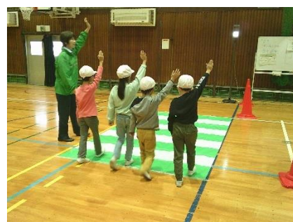
1・4年交通安全教室