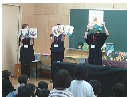
読み聞かせお楽しみ会