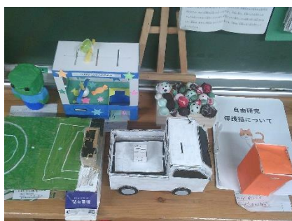
夏休み自由研究の作品