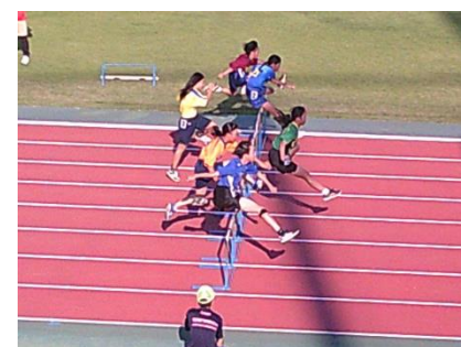
秋季市民陸上競技大会