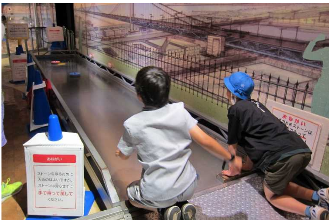
「ペアリング・カーリング」