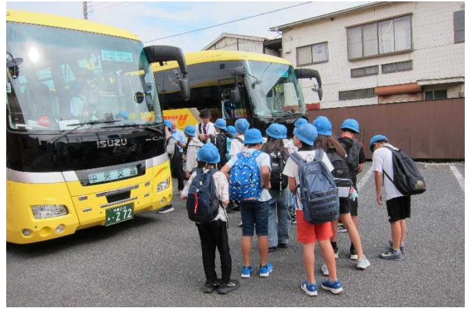
行きのバスに乗ります！