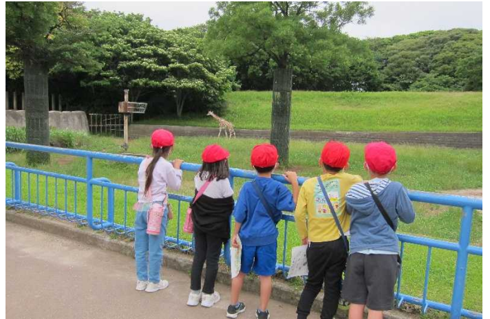
キリンを観察します