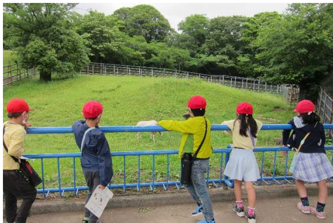
シロオリックスを見つめます