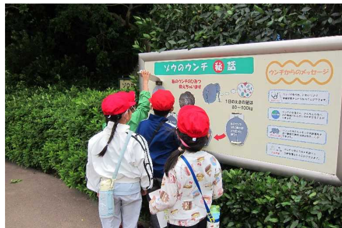
ゾウについてのクイズ