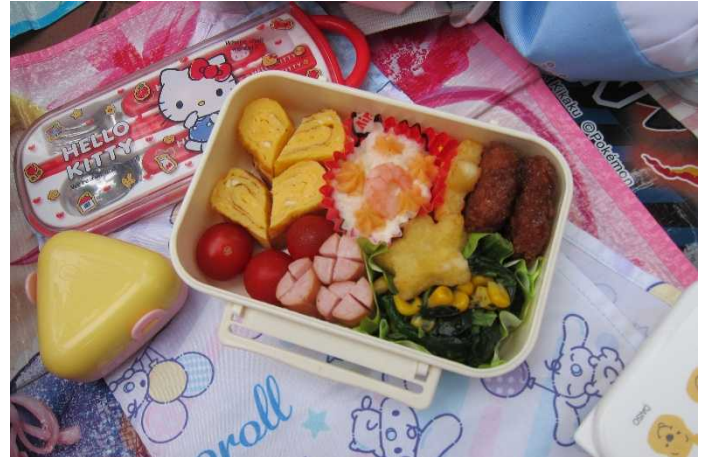
どのお弁当もおいしそうです