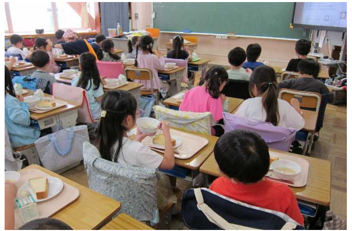
楽しく給食の時間を過ごします。