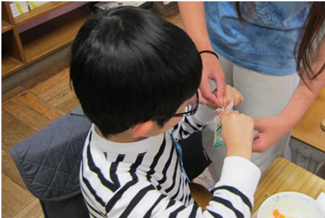
6年生に牛乳パックのたたみ方を教わります。