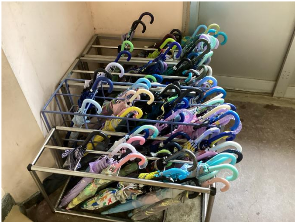
きれいに整頓された傘立て