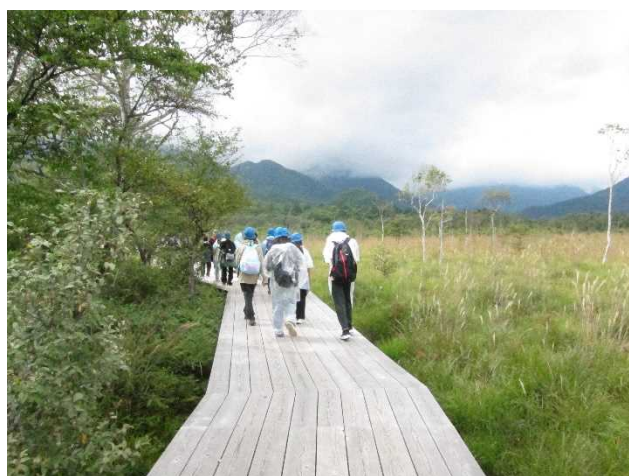
戦場ヶ原ハイキング