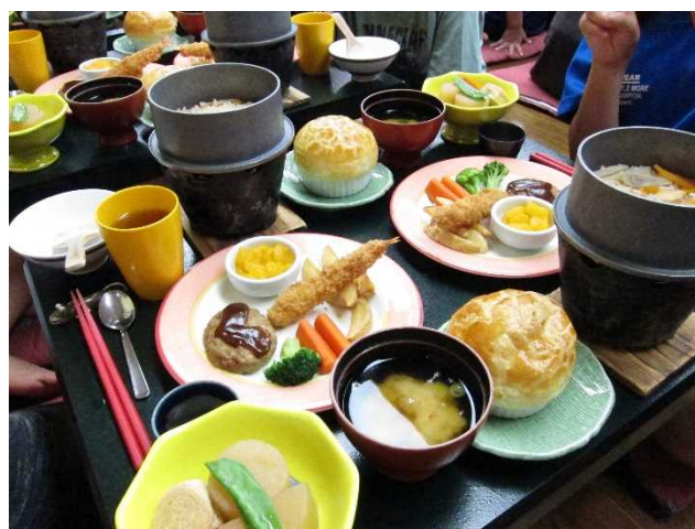
ホテル花の季の夕食