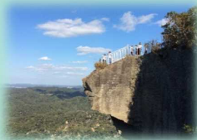
6月 鋸山ハイキング