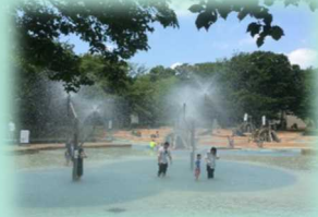
7月 アンデルセン公園