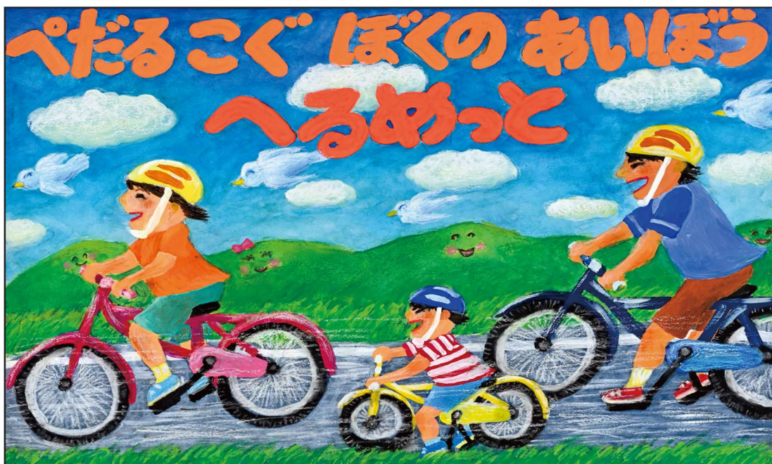
R5. 内閣府特命担当大臣賞