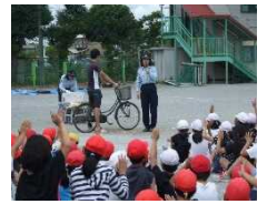
交通安全教室の様子 (令和4年度)